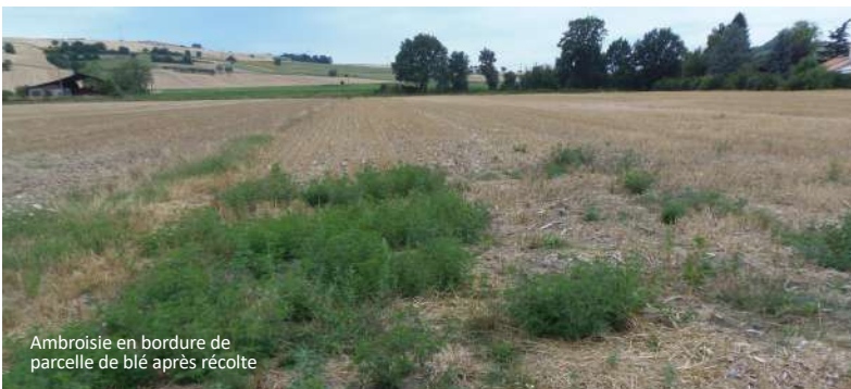
Ambrosie en bordure de parcelle de blé après récolte

Les cultures intermédiaires et autres couverts, s'ils sont mis en place rapidement après la récolte avec une installation rapide, apportent une compétition à l'ambroisie pour l'espace et les ressources. Ces couverts sont d'autant plus efficaces s'ils très couvrants (choisir des espèces adaptées).