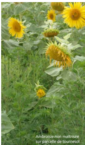
Ambrosie non maîtrisée sur parcelle de tournesol