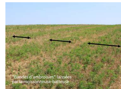
"Bandes d'ambrosies" laissées par la moissonneuse-batteuse

Plus de détails, consultez la brochure « Ambroisie et machines agricoles » éditée par l'Observatoire des ambrosies.